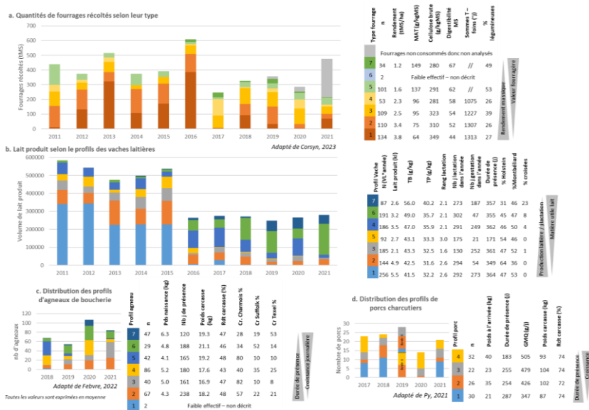
Figure 2 : Représentation des dynamiques des productions animales et des fourrages selon une approche typologique